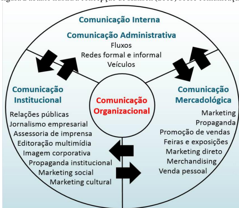
Figura 2 – Composto da Comunicação Organizacional Adaptado de Kunsch (2003)

Nesse contexto, a comunicação organizacional tem exercido um papel cada vez mais importante dentro das organizações modernas que buscam a excelência. Kunsch (2003) afirma que a comunicação organizacional é um fenômeno inerente aos agrupamentos de pessoas que integram uma organização ou se ligam a ela, configurando as diferentes modalidades comunicacionais que permeiam sua atividade. De acordo com a autora, a comunicação integrada compreende a comunicação institucional, a comunicação mercadológica, a comunicação interna e a comunicação administrativa, que formam o composto da comunicação organizacional, isto é, a convergência de todas as atividades institucionais baseadas em uma política global definida e nos objetivos gerais da organização, visando à eficiência organizacional através de ações comunicacionais estratégicas mais bem elaboradas e mais bem implantadas. A figura 2 abaixo ilustra a concepção de Kunsch (2003) sobre comunicação organizacional.