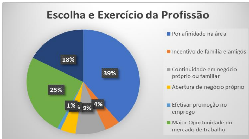
Figura 2– Escolha e exercício da profissão

Analisou-se também, o motivo pela escolha do curso, e observou-se que a maioria deles 39% decidiram cursar Ciências Contábeis por ter afinidade com a área, e logo em seguida, com 25% da amostra, com a justificativa de maior oportunidade de emprego.