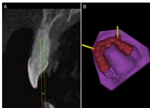
Figura 1 – Sequência tomográfica e virtual

A impressão do guia será feita em impressora 3D, e ao longo desse processo e após posicionada no arco do paciente, uma osteotomia poderá ser realizada para encaixar os pinos de fixação (Figura 1) (Lara-Mendes et al. , 2019; Shah; Chong, 2018).