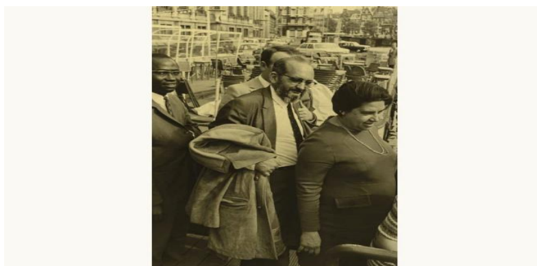
Exílio no Chile

Freire foi ao exílio, no Chile, depois, Estados Unidos, Suíça, e continuou trabalhando com projetos de alfabetização dos adultos. Lecionou em várias universidades, prestou assessorias a mais de 30 países, pelo Conselho Mundial das Igrejas (CMI), implementou projetos de educação em países africanos.