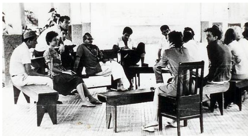
Paulo Freire alfabetizando em Angicos em 1963