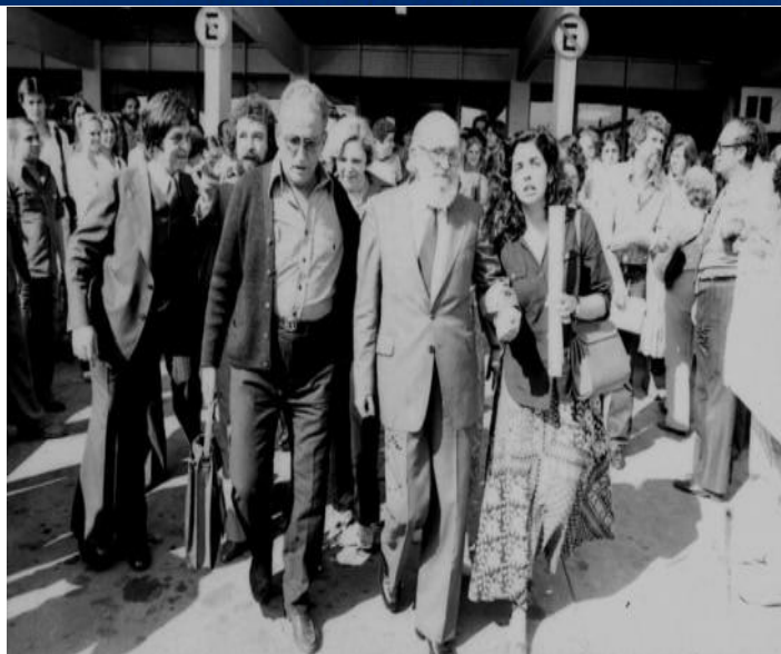
Chegada de Paulo Freire e família, em São Paulo.