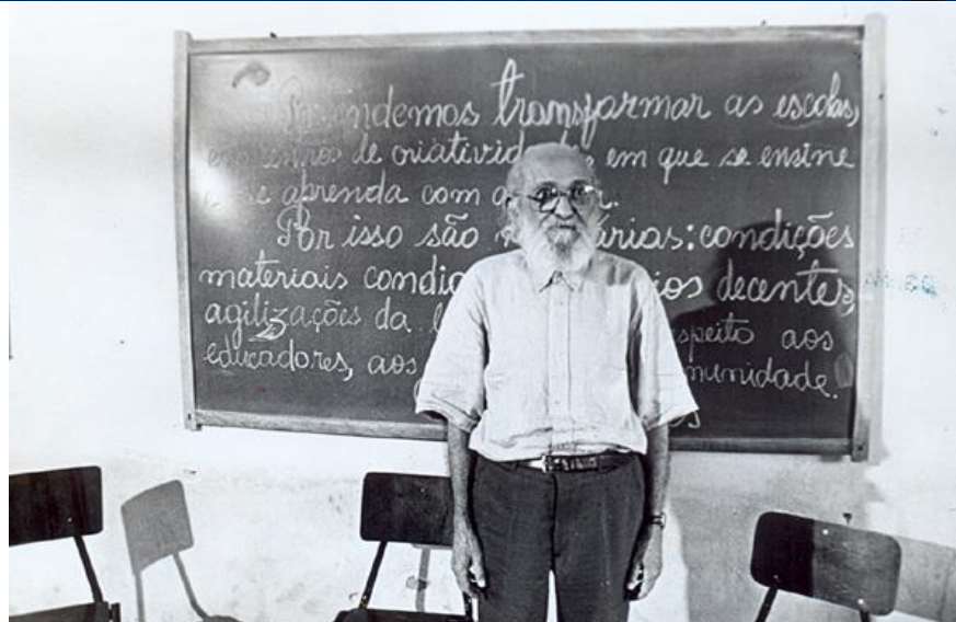
Paulo Freire em sala de aula – Angicos 1963