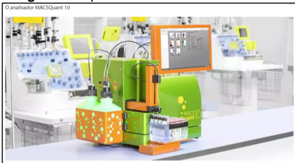
Figura 3: Separador de células MACSQuant10